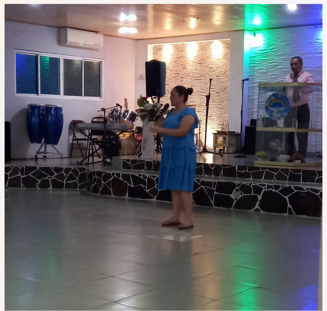
Presentando el reporte de trabajo del Viaje Misionero de Agosto a la Iglesia de la cual tenemos dos voluntarias en el equipo sirviendo.